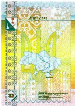
Внутрішній правий бік обкладинки (правий форзац)