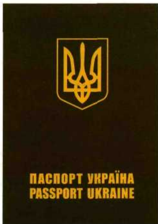
Лицьовий бік обкладинки