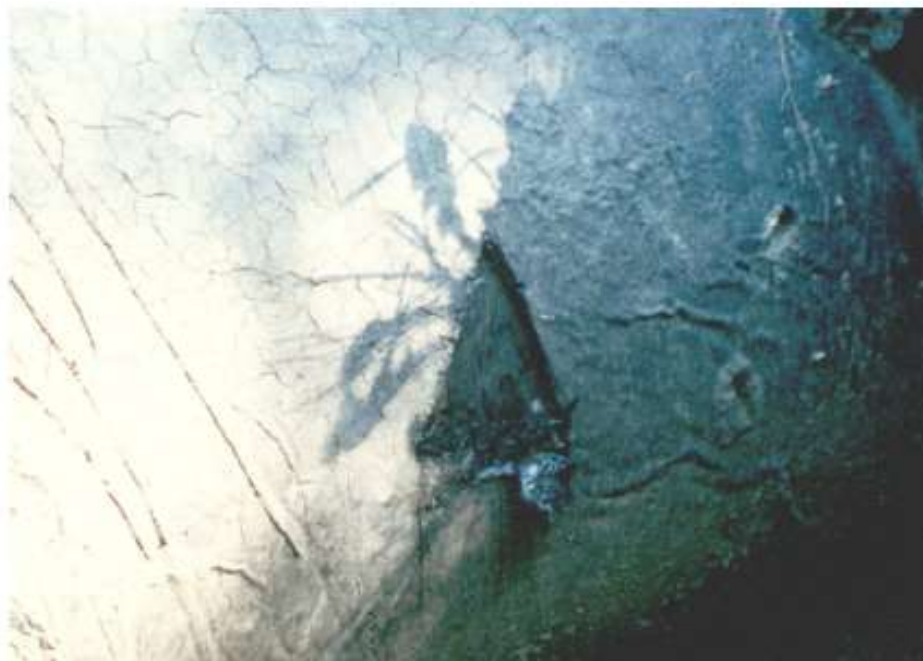
Рис. 1. Перевірка ізоляції методом трикутника

Додаток 3 до Порядку технічного огляду, обстеження, оцінки та паспортизації технічного стану, здійснення запобіжних заходів для безаварійного експлуатування систем газопостачання