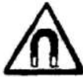
Сильне магнітне поле