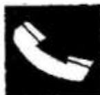
Телефонний апарат для аварійних викликів