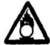
Пожежонебезпечні речовини. Окиснювачі