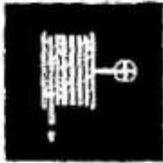
Пожезний рукав. Пожезний кран-комплект