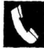
Телефонний апарат для оповіщення про пожежу

Примітка. Додатково до знаків пожежної безпеки можуть застосовуватися такі знаки, що вказують напрямок руху: