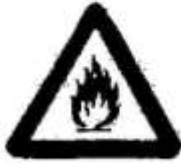
Вогненебезпечні речовини або висока температура. Легкозаймісті матеріали