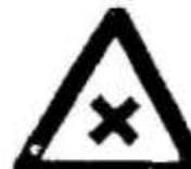
Шкідливі або подразнюючі речовини