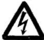
Небезпечна електрична напруга