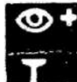
Пристрій для промивання очей